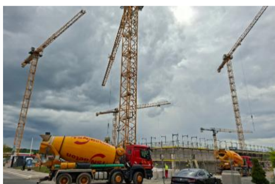
Auf der Großbaustelle für das Gefahrenabwehrzentrum (kurz: GAZ) herrscht reger Betrieb

Es ist eine Großbaustelle, wie sie in Hildesheim lange nicht zu sehen war: am Berliner Kreisel entsteht für rund 87 Millionen Euro das neue Gefahrenabwehrzentrum für Hildesheim. Auf dem 24.500 Quadratmeter großen und rund um die Uhr überwachten Grundstück