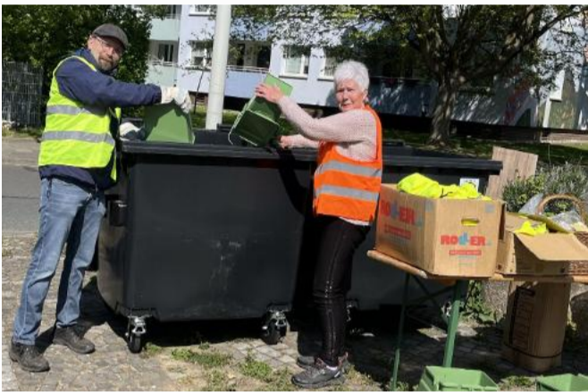
Ab in die Tonne! – Gemeinsam für eine saubere Nachbarschaft

Der alljährliche Frühjahrsputz ist Ende April wieder durch die Straßen, über die Plätze und Grünflächen des Stadtfelds gezogen. Die zwei großen Container, die der Zweckverband Abfallwirtschaft Hildesheim (kurz: ZAH) für die Aktion zur Verfügung gestellt hatte, waren am Ende des Tages fast voll. Drumherum sammelte sich der Sperrmüll, der aus Büschen und Ecken zur Sammelstelle getragen wurde: Teppichrollen, eine Matraze, Möbel, Elektroschrott, Autoreifen.