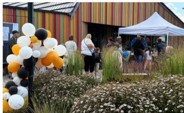
Wieder gibt's ein buntes Treiben am bunten Quartierszentrum Stadtfeld – der Treffpunkt für die Nachbarschaft ist auch Mittelpunkt des Sommerfestes

Es gibt nur wenige Gelegenheiten im Jahr, an denen das Stadtfeld zusammenkommt – eine davon ist das jährliche Stadtteil-Sommerfest, das bereits seit 2010 vom Gemeinwesenentwicklung Stadtfeld e.V. für die Nachbarschaft organisiert wird.