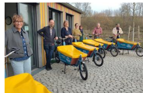
„Hilde-Familientreffen“: Viele Pat*innen der Hilde-Lastenfahrräder waren als Träger*innen des VCD-Preises „Spurwechsel“ angereist

„Spurwechsel“ heißt der „Fairkehrs-Preis“, mit dem der Verkehrsclub Deutschland (VCD) bereits seit 2022 Einzelpersonen, Gruppen oder Organisationen auszeichnet, die einen wirksamen Beitrag für nachhaltige Mobilität im Landkreis Hildesheim geleistet haben. In diesem Jahr ging der Preis an die derzeit 19 Ausleihstationen, die die „Hilde Lastenfahrräder“ in Stadt und Landkreis Hildesheim betreiben.