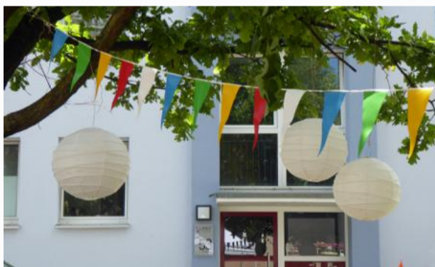
Festatmosphäre – Stadtfeld feiert den Sommer!

Auch 2026 wird den Besucher*innen des nachbarschaftlichen Familienfestes wieder viel geboten. Dafür tragen die zahlreichen Kooperationspartner*innen gemeinsam Sorge, die mit Spiel-, Spass- und Kreativ-Aktionen in Bewegung und ins Miteinander bringen wollen.