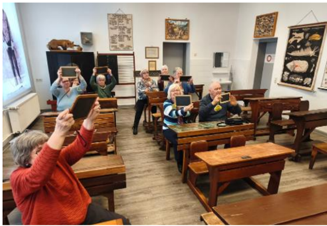
Zurück in die Vergangenheit! Senior*innen aus dem Stadtfeld verwandeln sich in Schüler*innen

Am 26.03.2026 machten elf Senior*innen eine Exkursion zum Schulmuseum in Hildesheim. Dieses Museum ist in den Räumen der Volkshochschule Hildesheim (ehemalige Freiherr-von-Stein-Schule) integriert.