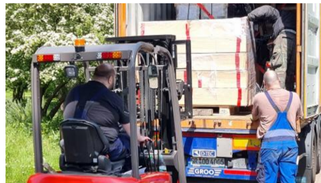
Ein Stapler verlädt eine neue Kiste auf einen LKW

Seit 31 Jahren werden mithilfe von Unterstützern Spenden aller Art gesammelt, insbesondere gebrauchte Werkzeuge, ganze Werkstatt- oder Praxiseinrichtungen sowie massive Schul- und Büromöbel. Diese Spenden werden, ganz im Sinn der Nachhaltigkeit, von den Beschäftigten unter fachkundiger Anleitung geprüft und aufgearbeitet. Sodann werden die Spendengüter über ein Netzwerk anderen in der Entwicklungshilfe tätigen gemeinnützigen Vereinen und Nichtregierungsorganisation zur Verfügung gestellt.