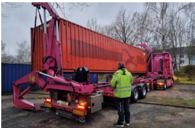
Hilfsgüter gehen auf die Reise: Verladung eines Containers mittels Seitenlader

Wenn durch das Stadtfeld ein Tieflader mit großem Container fährt, ist es wieder soweit: Bei „Arbeit und Dritte Welt e.V.“ (ADW) werden Spendengüter für ein Entwicklungsland verladen und versendet.