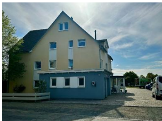
Die Hildesheim-Betreuungs-GmbH im Sauteichsfeld

Nach Anfrage des Stadtfeld live! möchten wir zukünftig unsere eigenen Artikel verfassen und aus unserem Alltag berichten. Zuerst wollen wir uns aber einmal vorstellen.