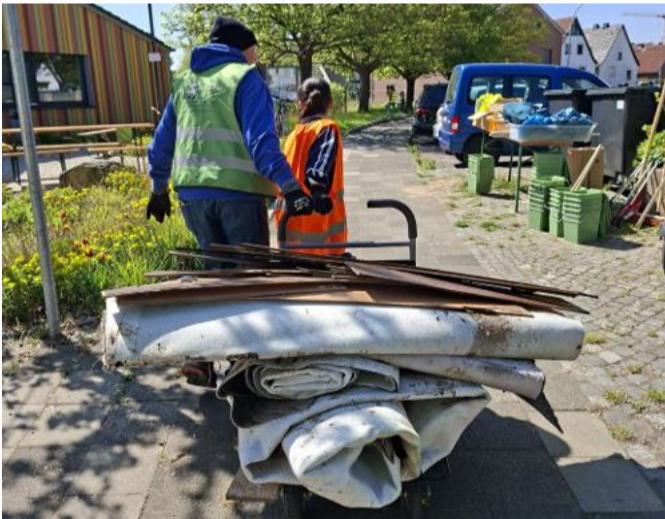
Hau-Ruck! – Auch viel Sperrmüll wurde wieder aus den Grünanlagen geholt

Der alljährliche Frühjahrsputz ist Ende April wieder durch die Straßen, über die Plätze und Grünflächen des Stadtfelds gezogen. Die zwei großen Container, die der Zweckverband Abfallwirtschaft Hildesheim (kurz: ZAH) für die Aktion zur Verfügung gestellt hatte, waren am Ende des Tages fast voll. Drumherum sammelte sich der Sperrmüll, der aus Büschen und Ecken zur Sammelstelle getragen wurde: Teppichrollen, eine Matraze, Möbel, Elektroschrott, Autoreifen.